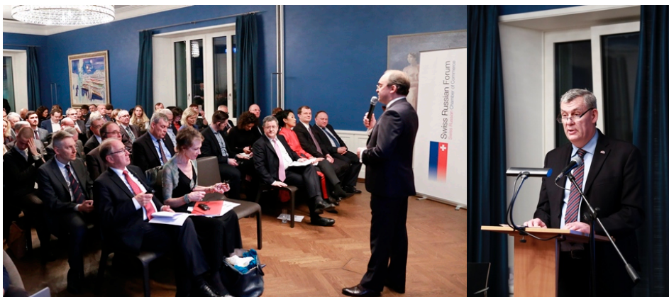
Suvorov Awardübergabe, November 11.11. 2019, Schweizer Botschaft, Moskau

Gemeinsam mit der Chamber of Commerce Switzerland – Russia werden wir im nächsten Jahr Russische und Schweizer Umweltinnovationen bewerten und der Sieger gewinnt den «Green Innovation» Suvorov Preis.